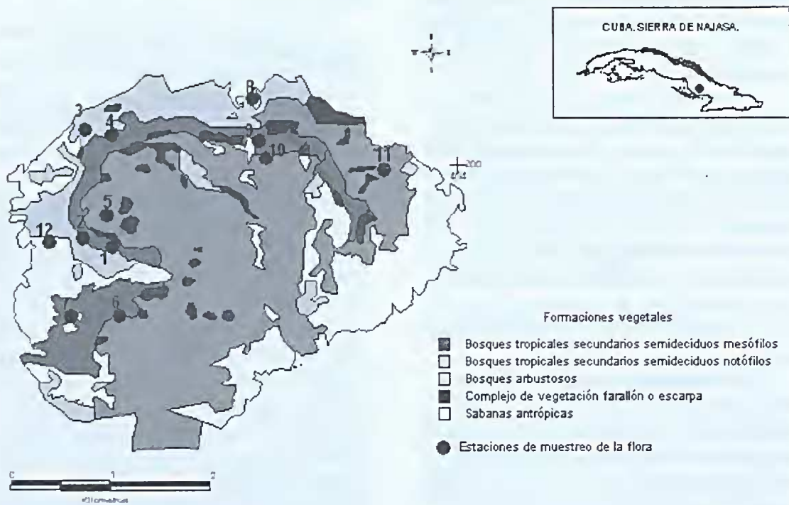
Figura 1 - Sierra Najasa: Vegetación.

Diospyros grisebachii (Hiern.) Standl. y Distictis gnaphalantha (A. Rich.) Urb. y, los de hábitats más restringidos Agave legrelliana Jacobi, Harrisia eriophora (Pfeiff.) Britt., Croton sagraeanus Muell. Arg. e Hyperbaena racemosa Urb. (Tabla 2).